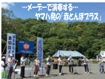
…メーデーで演奏する… ヤマハ発の「赤とんぼフラス」

エコパの芝生広場で、連合静岡中遠地協メーデーが開催。本年は、地元飲食店の協力による「どんぶり祭り」も行われました。