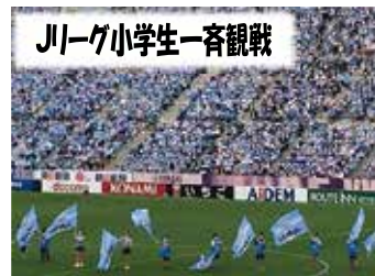
川ノグ小学生一斉観戦

スポーツのまちづくりの趣旨に賛同する団体や企業、市民が幅広く参加するプラットフォームづくりを目標としている。