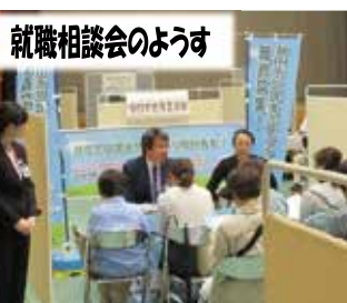
就職相談会のようす

A. 市民相談には解決すべき課題や政策立案のヒントが含まれている場合も多く、まずは部局をまたいだ情報共有をさらに促進していく。