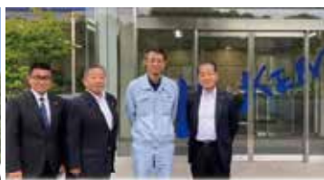
コーケン工業の玄関前で記念写真

社員の約1/5が60歳以上、障がい者の雇用率は常時5%以上。違いを越えて職場の仲間として働いています。