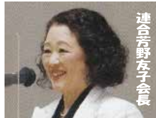
連合芳野女子会長

連合芳野会長の経験を踏まえた基調講演、企業経営者・大学教授・学生等によるパネルディスカッションで理解を深めました。