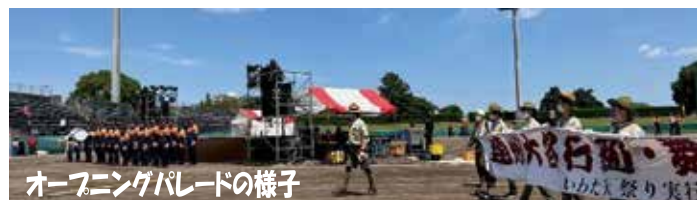
オープニングパレードの様子