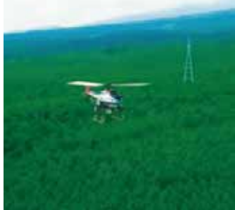
無人ヘリコプターによる森林計測のようす(参考例)

また、無人ヘリコプターによる森林計測等の新たな技術に農林環境専門職大学等の知見を加え、災害の危険性が高い箇所を抽出し、効率的かつ効果的に森林整備ができる仕組みづくりを公民連携で研究する計画である。