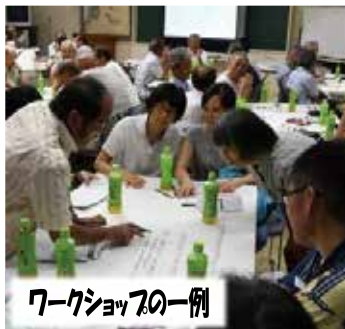
ワークショップの一例

A. (仮称)磐田市協働のまちづくり基本条例の策定に向けての市民ワークショップなど、市民との対話を通じて地域活動や市民活動の在り方を検討したい。